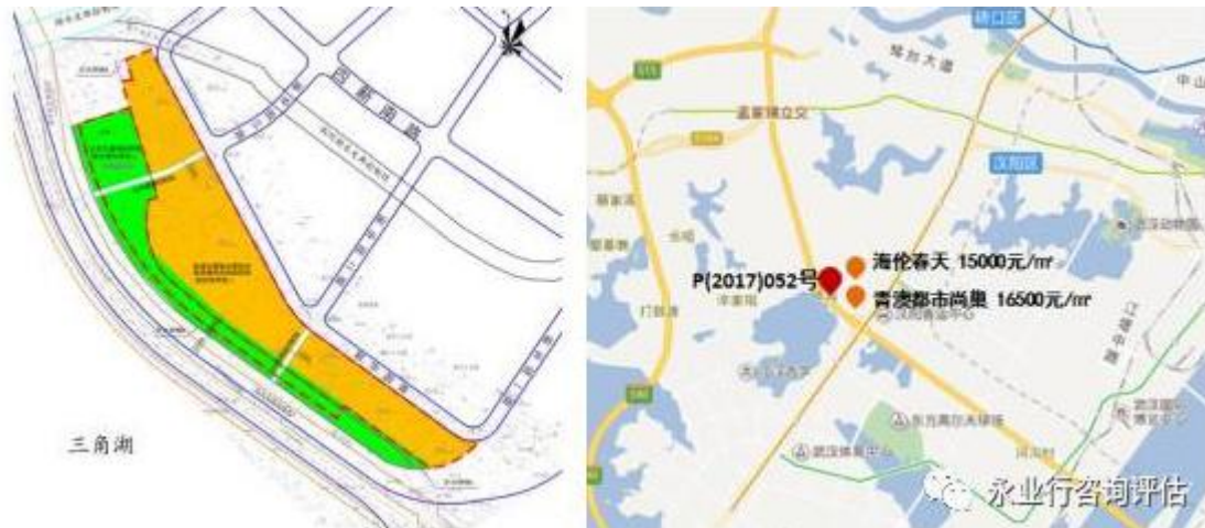
(052 号用地红线图和位置图)

地块周边已建成商业项目有金凯购物广场，经开万达等，临近住宅项目海伦春天售价 15000 元/m 2 左右，青澳都市尚巢 loft 公寓项目平均售价 16500 元/m 2 。